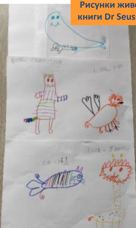
Рисунки животных из книги Dr Seuss от Арии