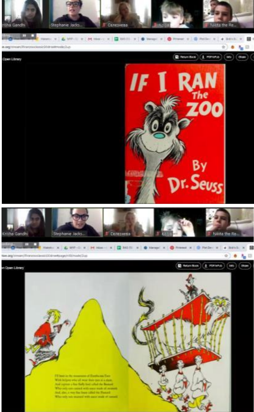
Мисс Стефани, Учитель английского языка и драмы

Работа вместе в команде и сообществе не уходит просто потому, что мы не можем быть рядом, и чтение друзей – пример нашей стойкости! Присоединяйтесь к нашему чтению друзей с понедельника по четверг в 13:30. А если вы (учащиеся и учителя) хотите стать волонтером и прочитать что-то, пожалуйста, напишите мне на sjackson@bis.kg . Информация для входа в Zoom дается в документах начальных классов на неделю, или можете написать мне, если у вас есть вопросы! С нетерпением ждем, чтобы скорее поделиться с вами своими рассказами!